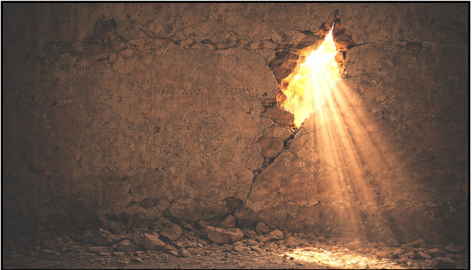
Erstellt mit chatGPT