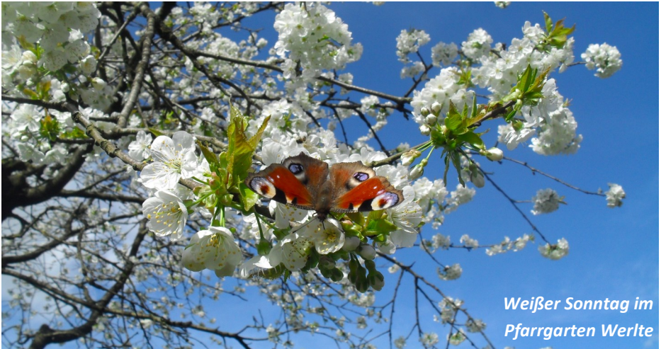
Weißer Sonntag im Pfarrgarten Werlte